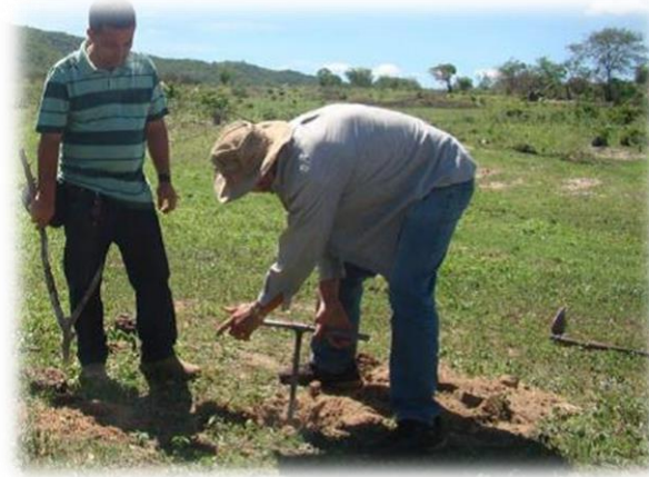
Figura 1: Sondagem do terreno

Além disso, é importante destacar que antes de iniciar a escavação é necessário realizar a sondagem do local. Para isso, é necessário escavar no mínimo três buracos, em linha reta, ao longo da possível vala, para se saber a profundidade do solo, a localização do cristalino/impermeável, através de valas com a profundidade pretendida do barreiro trincheira. Caso a sondagem não encontre camadas de areia e ao chegar a 4 ou 5 metros de profundidade, encontre a camada impermeável ou a rocha, o local pode ser considerado adequado para a escavação do barreiro trincheira.