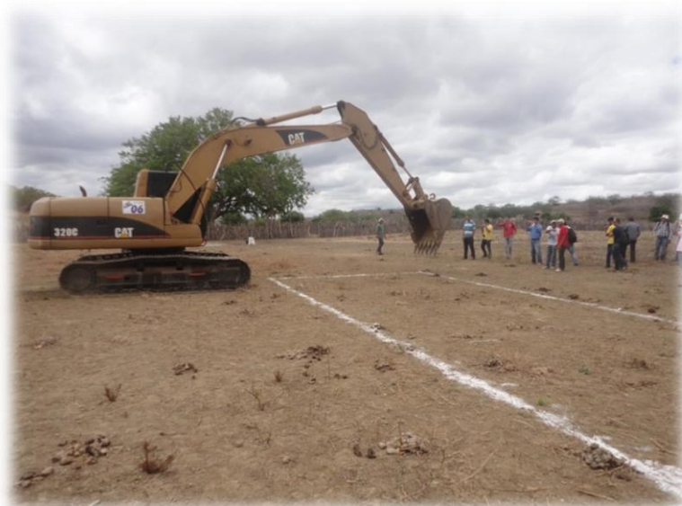
Figura 2: Marcação do terreno

Após a limpeza do local escolhido, é necessário demarcar com estacas de madeira a área a ser escavada. O contorno pode ser marcado com cal, areia branca ou mesmo riscado com a enxada.