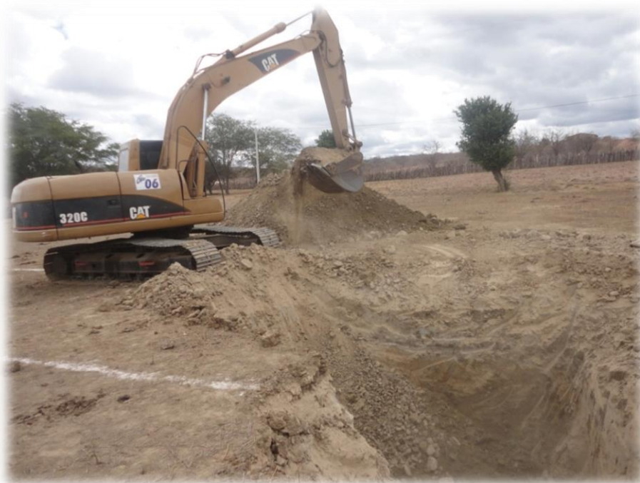
Figura 3: Escavação do buraco

O barreiro trincheira de referência é marcado com 16 metros de comprimento, 5 metros de profundidade e 5 metros de largura. A partir de então, se marca a rampa com 8 metros de comprimento e 5 metros de largura, iniciando com 5 metros de profundidade até alcançar o nível do solo. Podem ser feitas adaptações de acordo com as condições encontradas no local, modificando ligeiramente a profundidade, o comprimento total, o comprimento e a inclinação da rampa, conforme demonstrado na figura abaixo.