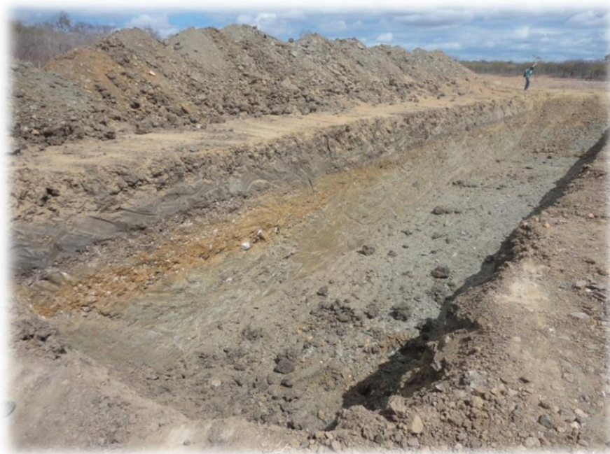
Figura 4: Finalização do barreiro

Considerando o tamanho padrão do barreiro, de 5 x 16 metros, com afastamento lateral de 3 m para cada lado e afastamento frontal de 2 m para cada lado: 2 \times 11 = 22 m e 2 \times 20 = 40 m, o perímetro total é de 62 metros. A quantidade de arame farpado foi calculada considerando a necessidade de vedar o acesso de caprinos, de forma que a cerca deve ter no mínimo 8 fios. Dessa forma, com 62 metros de perímetro e 8 fios de arame, são necessários cerca de 500 metros de arame. A quantidade de mourões de eucalipto tratado foi calculada pelo perímetro e pela distância entre os mourões, de 2 metros entre eles, e com altura de 2,20 metros. Dessa forma, são necessários 31 mourões, totalizando cerca de 70 metros lineares de madeira roliça de eucalipto tratado. Para a construção da cerca foi projetado o seguinte material.