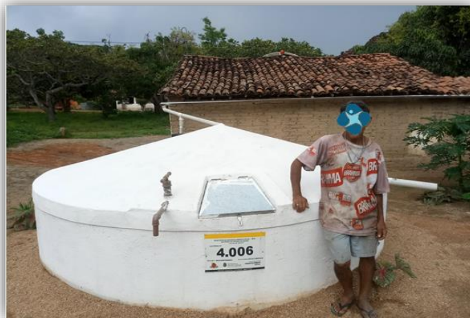
Foto 2 – Visualização do Sistema de Descarte, Filtro de Barro, Calha, Telhado e Beneficiário